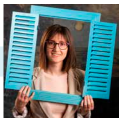
Ares Manasanch Administradora