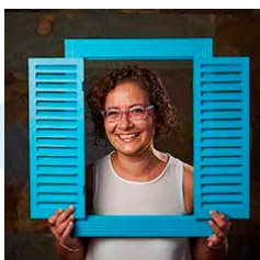
Mila Milla Sinistres